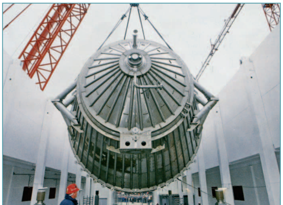
KATRIN am Ziel eines langen Weges: Das Ungetüm wird mit einem Kran in einen der vier Neubauten des Forschungszentrums Karlsruhe hineingehoben, die aus Thermodur Wandelementen errichtet wurden.

KATRIN ist die Abkürzung für KARlsruhe TRITium Neutrino, einem einzigartigem Experiment des Forschungszentrums Karlsruhe. Physiker suchen die Kräfte, die die Materie zusammenhalten. Maschinenbauer sind fasziniert vom nichtmagnetischen Spezialedestahl für den UHV-Tank. Uns bewegen die weiß gestrichenen Wände des unteren Bildes. Es sind Thermodur Wandelemente aus dem Werk Neuwied, die termingerecht und in der geforderten hohen Qualität in 2006 ausgeliefert wurden. Für insgesamt vier Neubauten des Forschungszentrums haben wir über 3.200 m 2 Wandelemente geliefert.