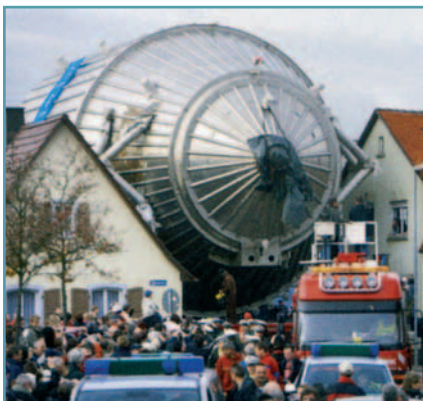
KATRIN muss auf seinem Weg durch Leopoldshafen millimetergenau zwischen den Häusern hindurch gesteuert werden.

Weitere Bauwerke waren ein Gebäude zur Biomasseumwandlung sowie eine Versorgungshalle. Sowohl der Baukonzern Züblin als auch die Bauunternehmung Grafried waren mit der unkomplizierten Planung und der hohen Qualität der Wandelemente sehr zufrieden – wieder zwei Thermodurstammkunden mehr.