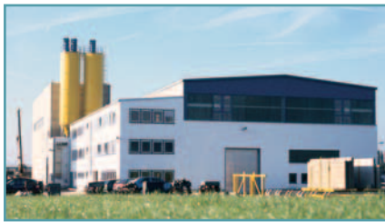
Verwaltungs- und Produktionsgebäude Thermodor Wandelemente, Neuwied

Am 01.01.2007 gründeten die Eigentümer der Thermodor Leichtbauelemente GmbH in Kottenheim und die Pinger Wandelemente GmbH & Co. KG in Neuwied eine neue Betriebsgesellschaft mit den Namen THERMODUR Wandelemente GmbH & Co. KG mit Sitz in Neuwied.