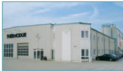
Produktionsgebäude Thermodor Wandelemente, Kottenheim

THERMODUR Wandelemente produziert in den Werken Kottenheim und Neuwied wärmedämmende Wandelemente aus haufwerksporigem Leichtbeton für den Industrie- und Gewerbebau.