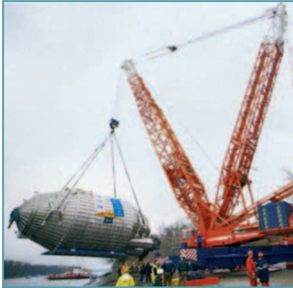
Am Rhein wird das Spektrometer von einem Schiff auf einen Tieflader gehoben, auf dem die letzten Kilometer bewältigt werden.

Bei einem Spektrometergebäude wurden im Vorfeld Varianten mit Edelstahlbewehrung untersucht, bei der die magnetischen Felder im Inneren des Gebäudes nur gering beeinflusst werden. Technisch wäre das für Thermodur kein Problem gewesen, da wir Stahldraht direkt vom Coil verarbeiten können und diesen nicht zu Matten verschweißen brauchen. Aus wirtschaftlichen Gründen kam dann verzinkter Betonstahl zum Einsatz.