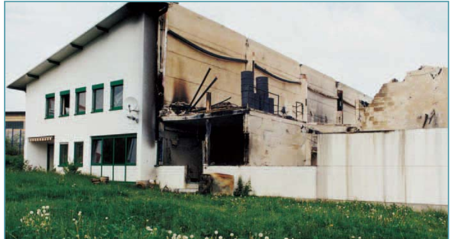
Ein schwerer Brand zerstörte die Stahlhalle. Dank der PINGER Brandwand blieb das Bürogebäude unbeschädigt.

Anschlüsse von Trapezblechdächern beeinträchtigen die Feuerwiderstandsdauer der klassifizierten Bimsbetonwände nicht. Hinsichtlich der brandschutztechnischen Anforderungen an Trapezblechdächer, Brandwände und Wände an die brandschutztechnische Anforderungen gestellt werden sind die bauaufsichtlichen Anforderungen zu beachten.