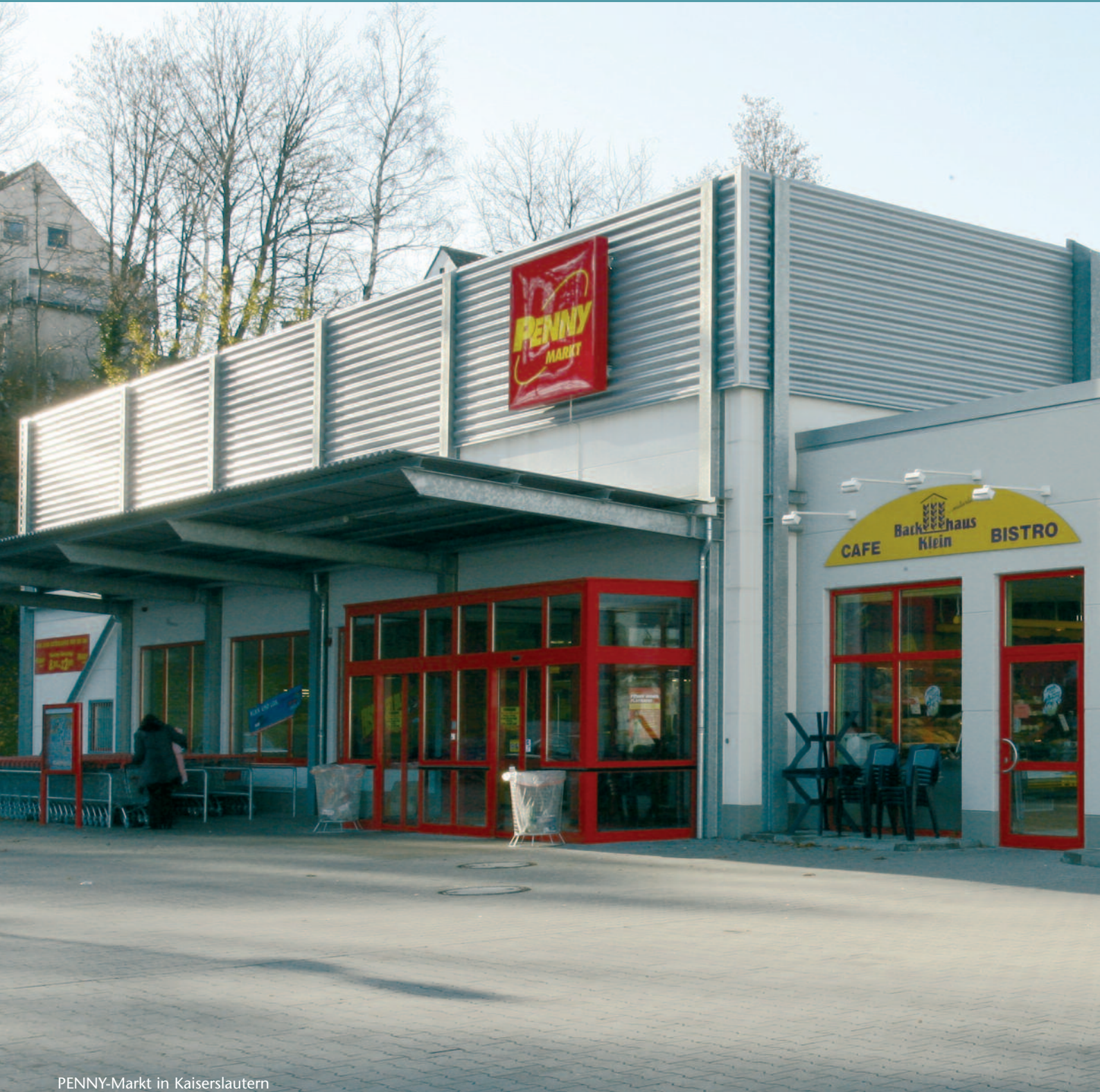
PENNY-Markt in Kaiserslautern