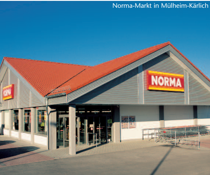
Norma-Markt in Mülheim-Kärlich

Aufgrund ihres hohen Vorfertigungsgrades eignen sich THERMODUR Wandelemente besonders für Verbrauchermärkte, weil sich hierdurch Zeit und Kosten einsparen lassen. Alle Außenwandelemente werden schon ab Werk mit einem wasserabweisenden Außenputz versehen sowie einem streichfertigen, schalungsglatten Zementmörtel auf der Wandinnenseite.