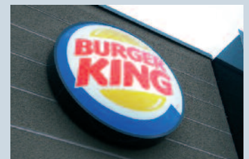
Burger King im Frankenthal