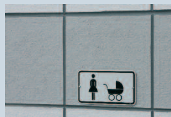
Hilgard-Center in Zweibrücken