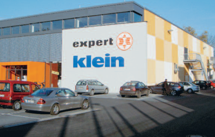
Expert Klein in Koblenz

Aufgrund ihres hohen Vorfertigungsgrades werden THERMODUR Wandelemente bei vielen Einkaufszentren und Fachmärkten im Einzel- und Großhandel verwendet. Die Montage ist witterungsunabhängig auch im Winter möglich, der wasserabweisende Außenputz ist werkseitig bereits aufgebracht. Sie profitieren von kurzen Bauzeiten, geringeren Kosten und höherer Qualität. Konkret bedeutet dies für den Bauherrn: besser und sicherer planen, früher fertig stellen und damit schneller Umsätze machen.