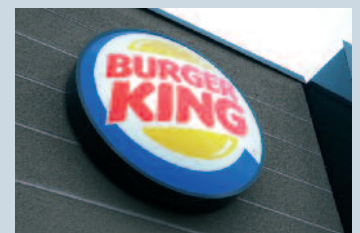
Burger King im Frankenthal