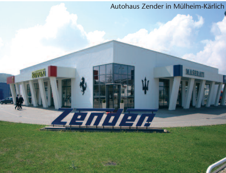
Autohaus Zender in Mülheim-Kärlich

Vom Suzuki-Händler bis zum Michael Schumacher Kart-Center in Kerpen, zusammenfassend bedeuten THERMODUR Wandelemente für den Bauherren konkret: besser und sicherer planen, früher fertig stellen und damit schneller Umsätze machen.