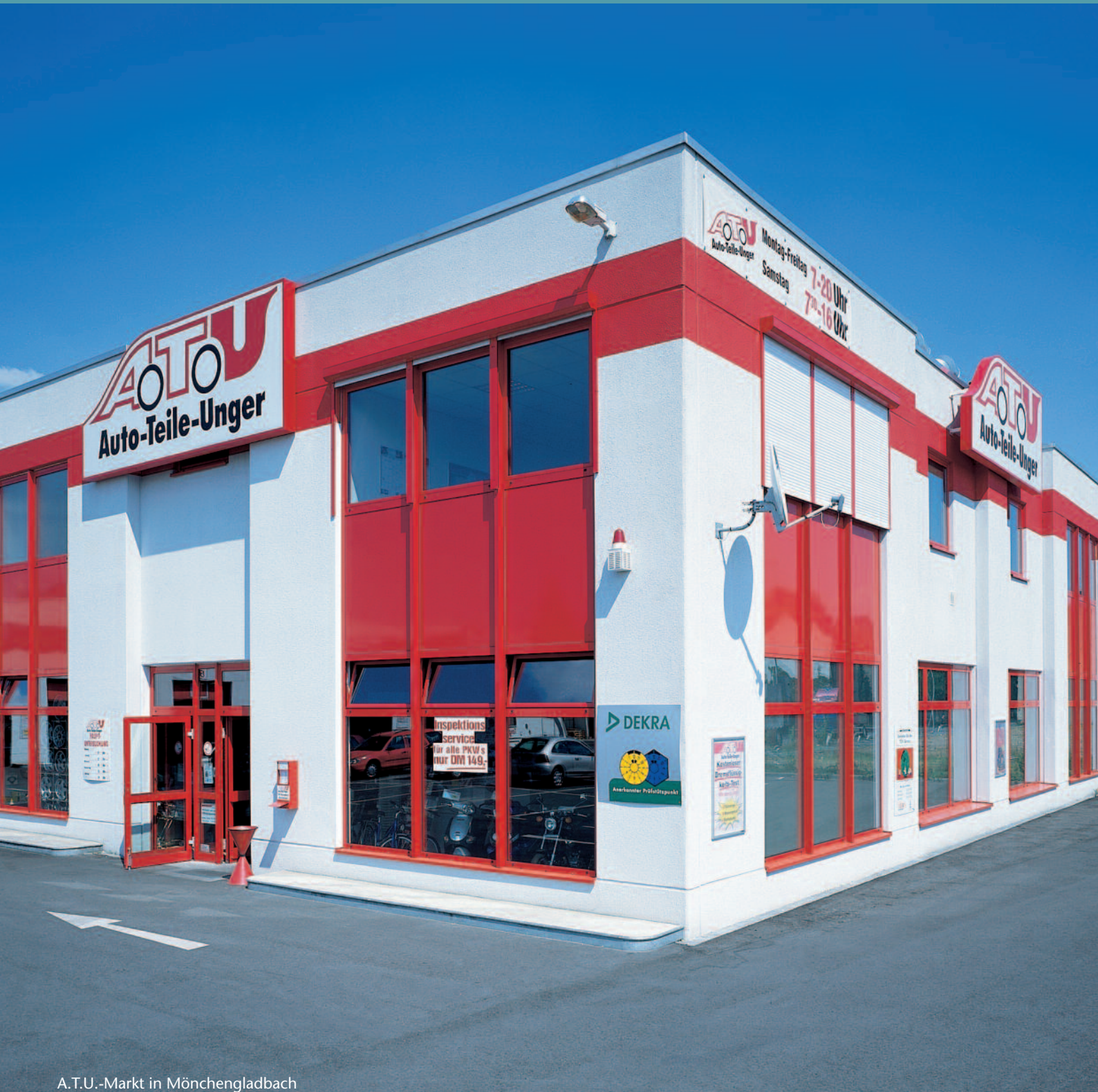
A.T.U.-Markt in Mönchengladbach