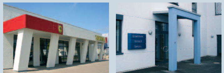
Details Autohaus Zender und Truck Center