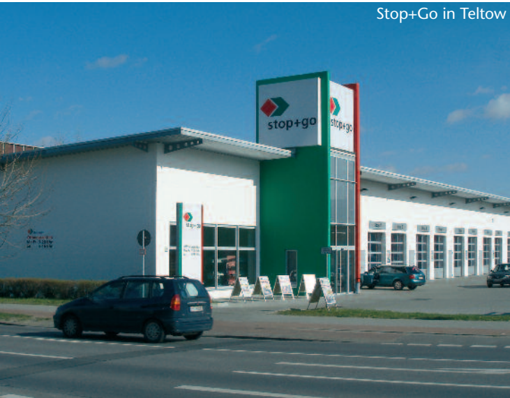
Stop+Go in Teltow

Auto-Teile-Unger ist mit über 625 Filialen in ganz Deutschland der führende Teile- und Serviceanbieter rund ums Auto. Der überwiegende Teil der Gebäude wurde mit THERMODUR Wandelementen verwirklicht. Die Fertigteillösung ermöglicht einen schnellen Baufortschritt, so dass vom Beginn der Erdarbeiten bis zur Übergabe an den Marktleiter nur 12 bis 14 Wochen vergehen. Die Montage der Außen- und Innenwände dauert dabei nur ein bis zwei Wochen.